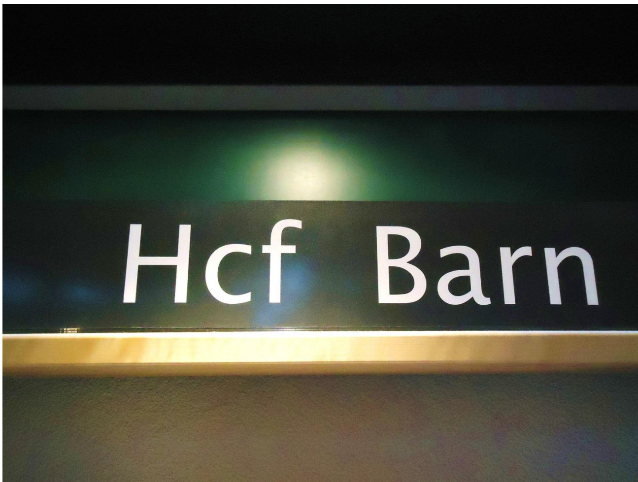
Haninge kulturhus.