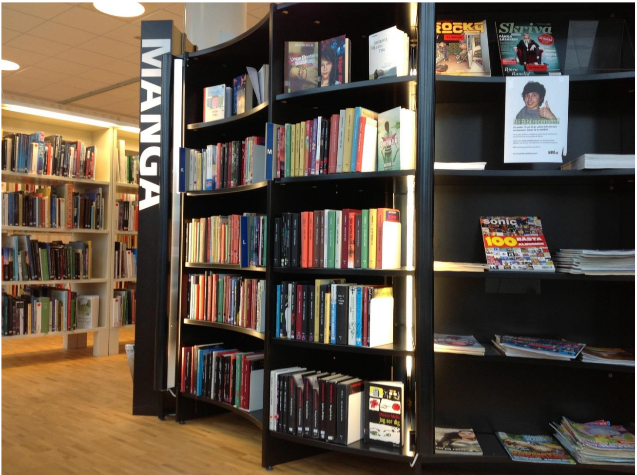
Folkbiblioteket i Knivsta.