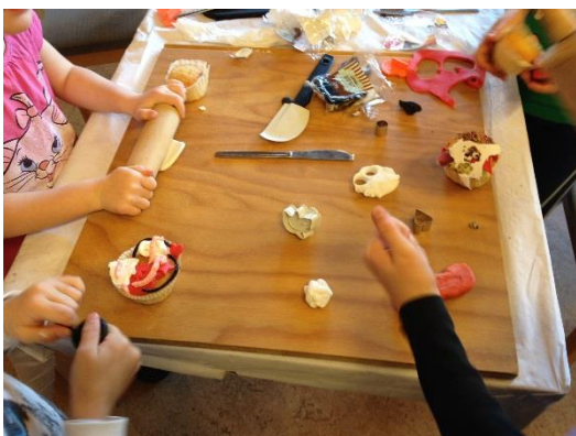
Barnen gör monstercupcakes på höstlovet.

Anpassade medier för barn och unga med särskilda behov, såsom talböcker, ska finnas och erbjudas. Biblioteket ska också anpassa sitt bestånd av barnmedier på andra språk utifrån de språkgrupper och språkbehov som finns i kommunen.