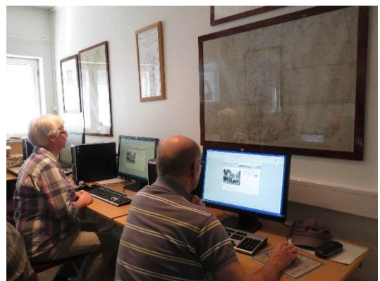
Två personer bekantar sig med Internet under en studiecirkel i data.

Biblioteket ska arbeta för att minska den digitala klyftan i samhället genom att erbjuda kostnadsfria individuella handledningar och studiecirkel i data och MIK (medie- och informationskunnighet). MIK omfattar den kunskap och de färdigheter som behövs för att ta del av samt utöva de demokratiska rättigheterna i dagens digitala samhälle. Digital kompetens, förmågan att aktivt kunna söka, hitta, kritiskt granska och använda digitala informationskällor hör till dessa färdigheter.